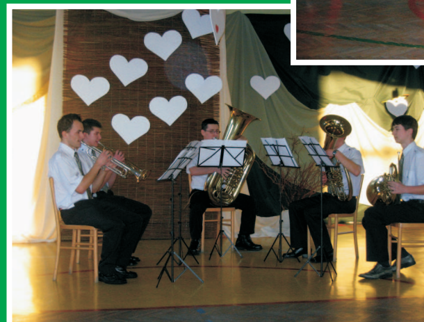
Przeegląd Twórczości Dzieci i Młodzieży - Konopiska 2006