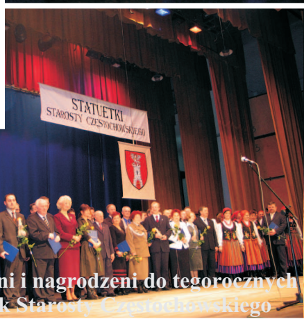
Nominowani i nagrodzeni do tegorocznych Statuetek Starosty Częstochowskiego