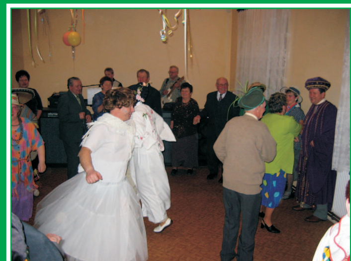
Ostatki - Kopalnia 2006