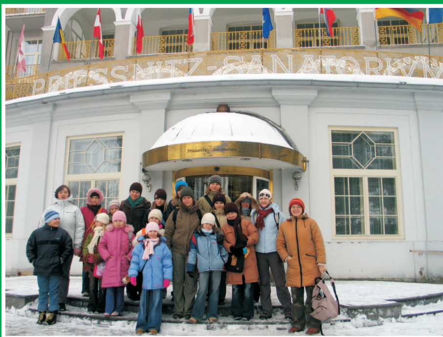
Obóz taneczny Pokrzywna 2006